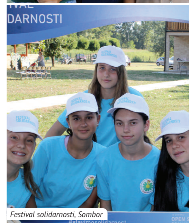
Festival solidarnosti, Sombor