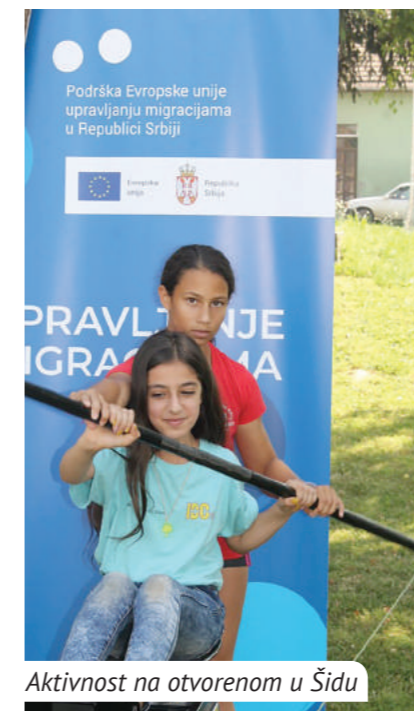
Aktivnost na otvorenom u Šidu

Oko 700 učesnika aktivnosti Fondacije Ana i Vlade Divac, svedoči o mogućnosti suživota ljudi koji su morali da napuste svoje kuće i ljudi u Srbiji koji su prevazišli sve prepreke koje mogu nastati u ovakvim situacijama. Svi koji su učestvovali u akcijama nastavili su druženja i van projekta, po svojoj inicijativi, na a to je upravo bio cilj.