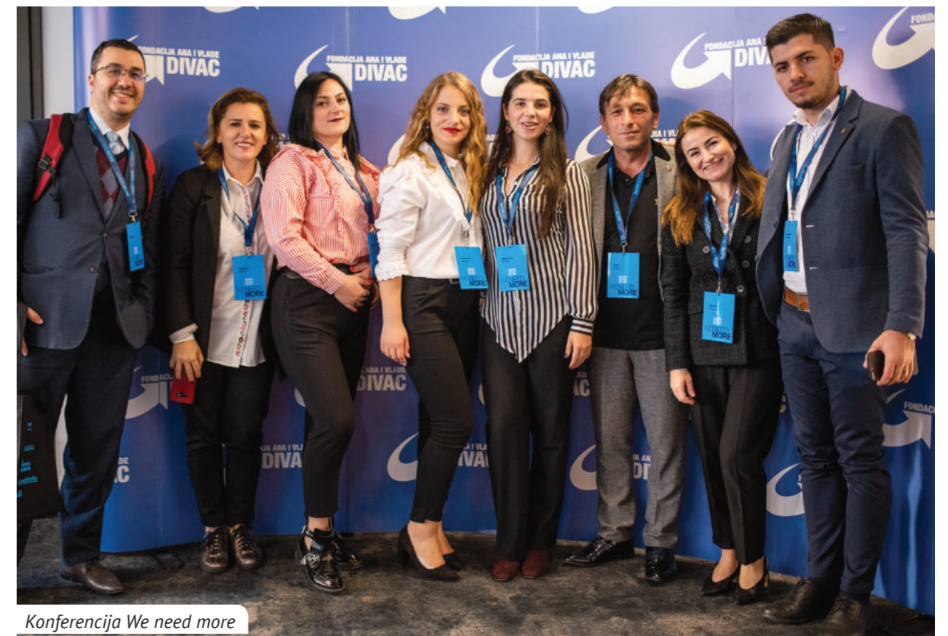
Konferencija We need more

U okviru kampanje oraganizovano je preko 40 nacionalnih i lokalnih događaja kako bi se podigla svest i podstakla saradnja da što pre krenem u rešavanje nekih od akutnih problema. Na kraju godine organizovana je i jedna od najvećih regionalnih omladinskih konferencije „Young people in Western Balkan and Turkey: WE NEED MORE“. Konferenciju su podržali svi najznačajniji nacionalni i regionalni akteri u omladinskoj politici: Ministarstva za mlade iz Srbije, Crne Gore, Severne Makedonije, Albanije i po prvi put Turske, Delegacija Evropske unije u Srbiji, Krovna organizacija mladih Srbije, Regionalna kancelarija za saradnju mladih (RYCO), Fonda za Zapadni Balkan, Regionalni savet za saradnju, kao i preko 200 predstavnika omladinskih organizacija i mladih. Mrežu omladinskih fondova za Zapadni Balkan i Tursku postoji od 2016. godine i finansijski je podržana od strane Evropske komisije.