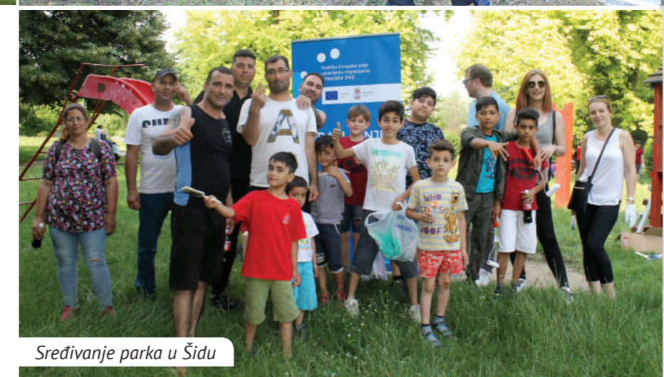
Sređivanje parka u Šidu