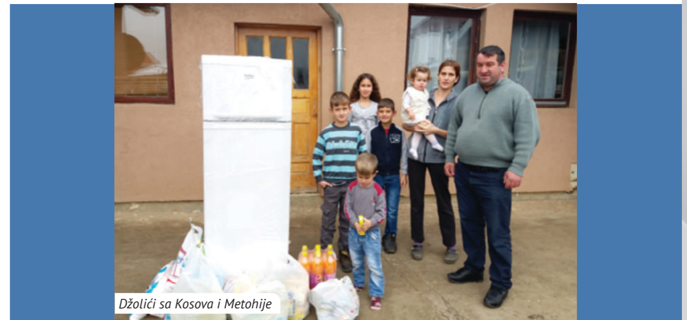
Džolici sa Kosova i Metohije

Fondacija Ana i Vlade Divac pomagala je najsiromašnijim porodicama širom Srbije, Kosova i Metohije i Republike Srpske. Najviše smo bili fokusirani na potrebe dece i obezbedili smo odeću, tople čizme, za porodice peći, frižideri, drva. U 2019. godini pomogli smo više od 3.000 ljudi širom Srbije. Ljudima su obezbeđena hrana, higijenski paketi, novogodišnji pokloni, tople jakne i zimska obuća, ovce, koze, svinje, poljoprivredna mehanizacija, plastenici, čak i besplatan prevoz do grada. Većina seljana u blizini Kuršumlijske Banje dobila je nove toalete prvi put u životu, popravljani su prozori, rekonstruisani krovovi, staje, a za dve porodice su kupljene nove kuće.