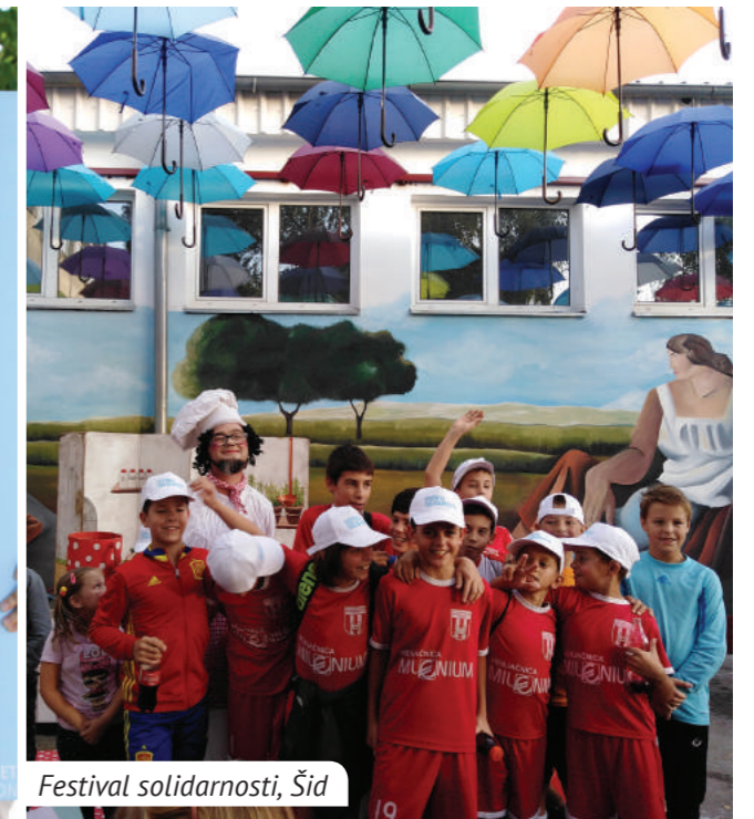
Festival solidarnosti, Šid