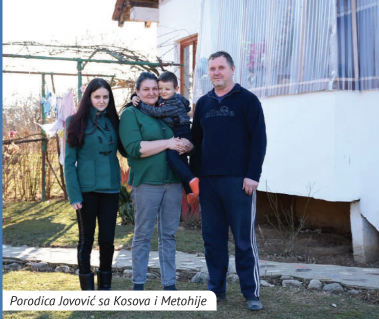
Porodica Jovović sa Kosova i Metohije