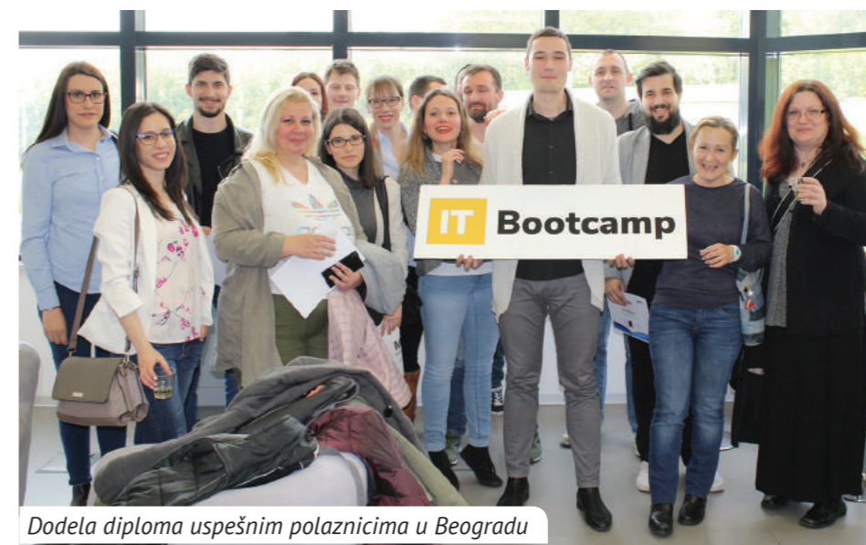
Dodela diploma uspešnim polaznicima u Beogradu

2018. osnovan je IT Bootcamp - neprofitna i besplatna škola za prekvalifikaciju u IT sektor. Škola je rezultat inicijative i donacija srpske dijaspore iz Njujorka i strateške saradnje sa Fondacijom Ana i Vlade Divac, a osnivači škole su uspešni ljudi iz dijaspore koji su ujedno i donatori škole. Cilj škole je da obezbedi besplatno obrazovanje motivisanim pojedincima u Srbiji koji su voljni da pronađu posao u IT sektoru. Nakon uspešnog pilot projekta koji je izveden u Beogradu, škola je nastavila sa radom i 2019. godine i proširila se na grad Niš. Do kraja decembra 2019. godine 291 polaznik je uspešno završio školu u Beogradu i Nišu, od kojih je, u IT kompanijama, 125 našlo posao ili praksu, odnosno 42%. Očekuje se da će se ovaj broj povećati u narednom periodu jer polaznici koji su kurseve završili u decembru 2019. trenutno prolaze proces selekcije u kompanijama. Tokom 2019. godine predavanja u Beogradu i Nišu su se održavala u učionicama na sledećim lokacijama: Naučno-tehnološki park – Beograd, Mašinski fakultet – Beograd, Prirodno-matematički fakultet – Beograd, Think Innovative – Niš.