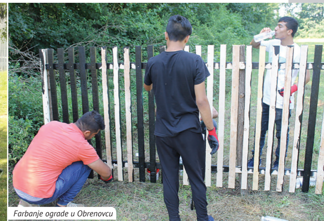
Farbanje ograde u Obrenovcu