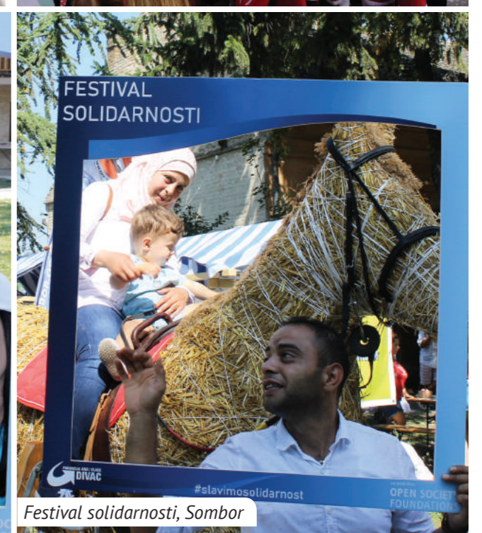
Festival solidarnosti, Sombor