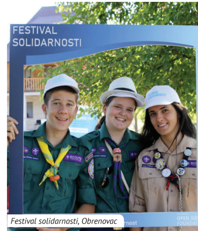
Festival solidarnosti, Obrenovac

Tokom 2019. godine podržana je 21 inicijativa iz Sombora, Šida i Obrenovca, u ukupnoj vrednosti od 70.000 dolara.