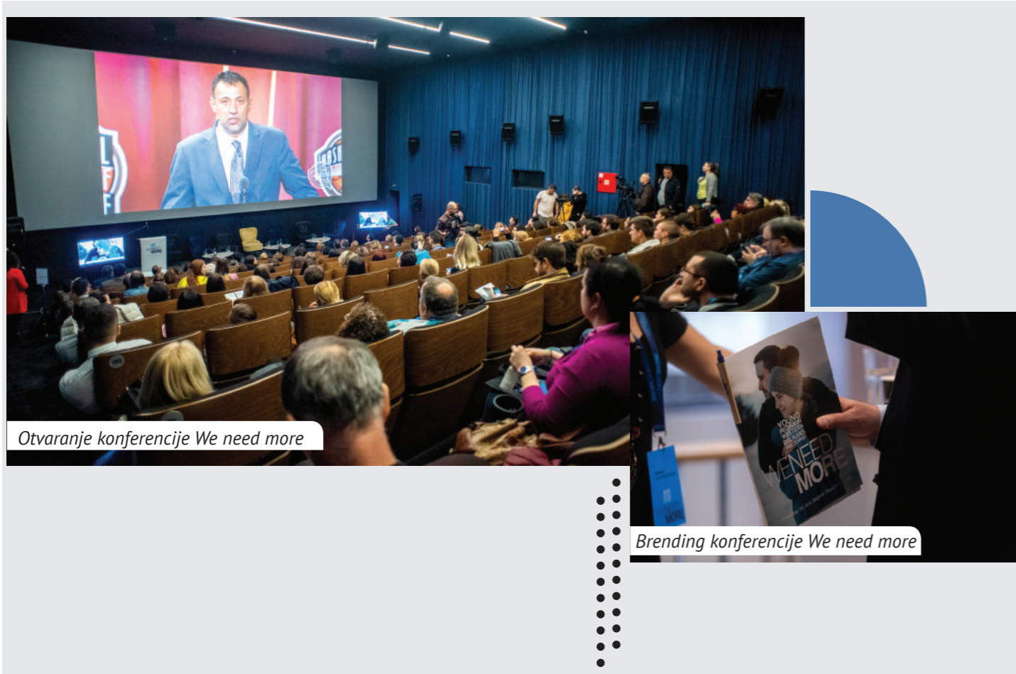
Otvaranje konferencije We need more