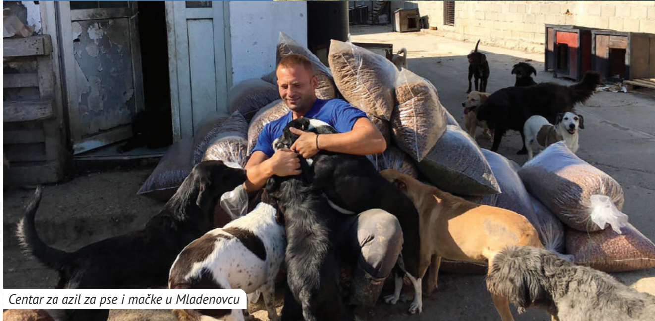
Centar za azil za pse i mačke u Mladenovcu