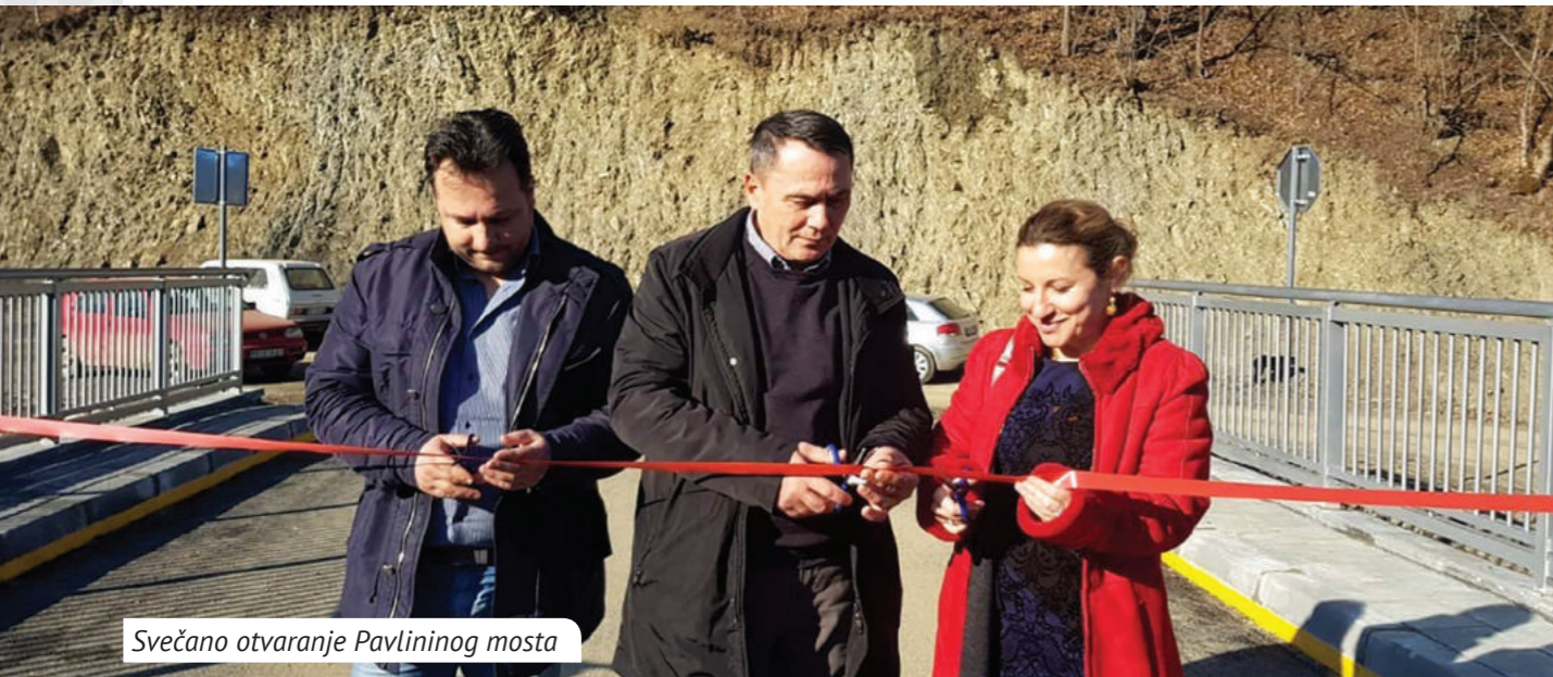
Svečano otvaranje Pavlininog mosta