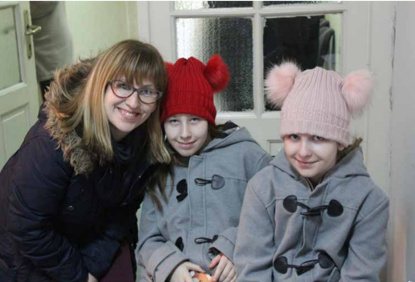
Podela paketa za jednoroditeljske porodice

U okviru obezbeđivanja jednokratne humanitarne pomoći, Fondacija Ana i Vlade Divac nije zaboravila ni jednoroditeljske porodice koje su prepoznate kao kategorija stanovništva koja je češće izložena siromaštvu i socijalnoj isključenosti. Nekoliko hiljada porodica gde se jedan roditelj brine o deci, dobilo je pakete hrane u akciji koju je Fondacija realizovala u saradnji sa JKP "Infostan".