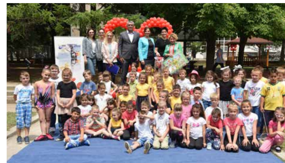
Veliko srce u Mladenovcu

Eurobank i Fondacija Ana i Vlade Divac su od 2010, kada je projekat „Veliko srce“ pokrenut, obnovili smo skoro 50 igrališta u dečijim vrtićima, kao i veliki broj prostorija u školama i zdravstvenim ustanovama u kojima borave deca. Zahvaljujući akciji, desetine hiljada mališana širom Srbije dobili su kvalitetne uslove za igru, učenje i srećnije detinjstvo.