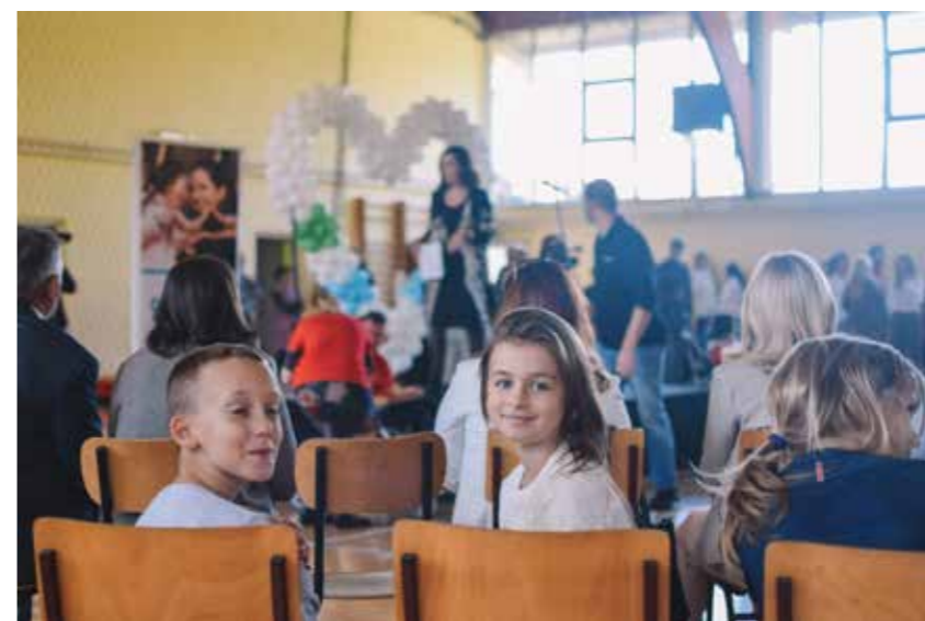
Senzorna soba u Srednjoj zanatskoj školi u Rakovici