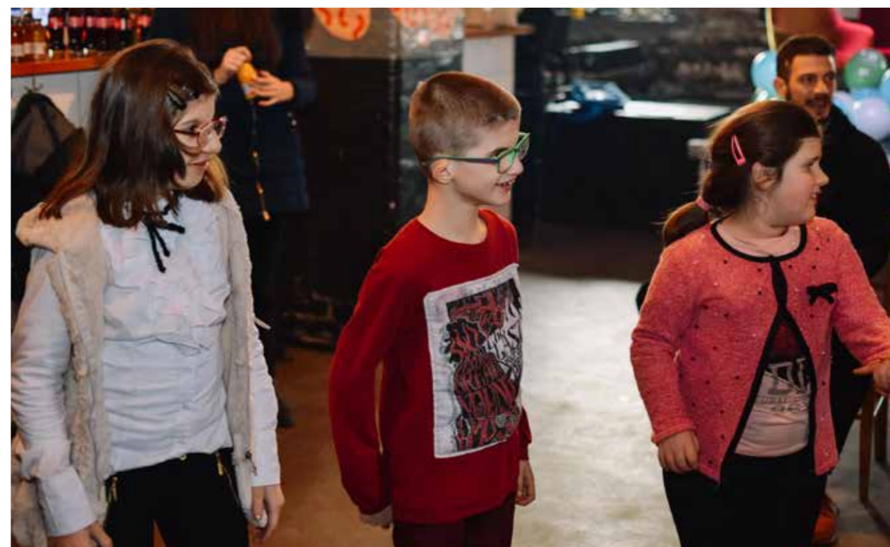
Da rastemo srećni - proslava rezultata u KC Gradu