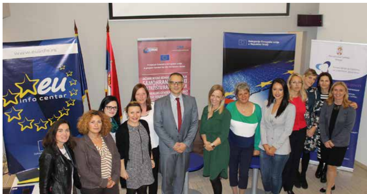
Podrška samohranim majkama na tržištu rada

U jednoj od najsiriomašnjih opština u Srbija u cilju osnaživanja žena osnovano je Udruženje Lužničke ruktovrine Ž.E.C. koje od 2009. pruža uslugu pomoć u kući za stare. Od 2015. započele su privrednu delatnost, kako bi uposlile žene iz ovog okruga i obezbedile sredstva za svoje socijalne usluge. Tokom 2018. godine osnovali su sa kooperantima zadruhu Darovi lužnice registrovanih domaćinstva koja su otpočela organsku proizvodnju. U okviru projekta Jačanje rodne jednakosti i položaja samohranih majki na tržištu rada pokrenule su sertifikovanu obuku za organsku proizvodnju koju je prošlo 12 samohranih majki iz Babušnice.