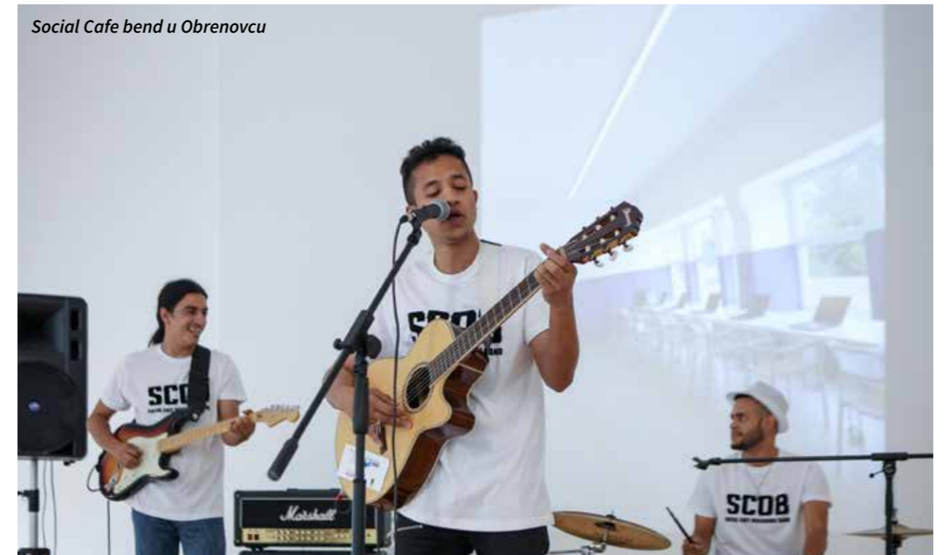
Social Cafe bend u Obrenovcu

U Prihvatnom centru u Obrenovcu i Centru za azil u Krnjači, u okviru projekta „Social Cafe“, kreirane su IT, ekološke, muzičke, stolarske i kreativne radionice na kojima migranti mogu da razvijaju različite veštine i kvalitetno provode vreme. Takođe, tokom 2018. godine organizovani su časovi engleskog i srpskog jezika za sve uzraste, ali su korisnici u saradnji sa volonterima u centru oformili i jedinstven bend Social Cafe sa članovima sa pet kontinenata.