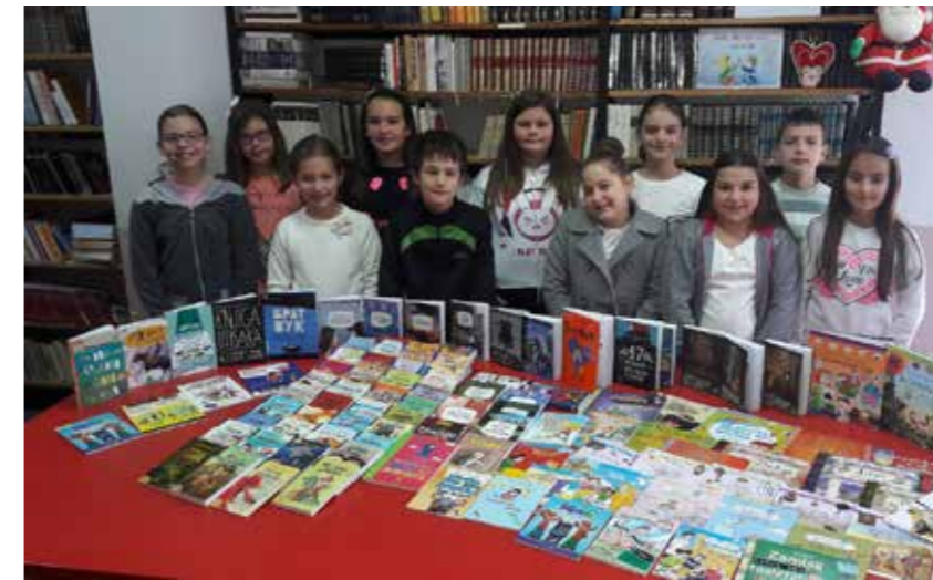
Deca iz OŠ Julijana Čatić, Stragari

Unapređenje uslova za odrastanje i obrazovanje dece i omladine i podrška omladinskim projektima je oblast u koju Fondacija Divac ulaže godinama unazad. I tokom protekle godine kroz različite projekte obnovljeno je i opremljeno 10 škola i vrtića, uključujući i škole za decu sa smetnjama u razvoju koje svakodnevno pohađa više od 5.000 dece . I ove godine, zahvaljujući donacijama kupaca koje su se našle u kutijama tržnog centra Kragujevac Plaza, nastavljamo tradiciju obnavljanja fondova školskih biblioteka kako bi se unapredilo znanje učenika i kroz vreme provedeno uz knjigu doprinelo njihovom srećnijem odrastanju.