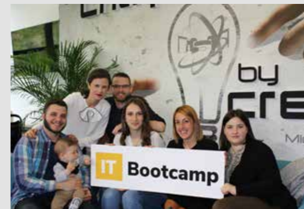
IT Bootcamp - dodela diploma

Kurs za testiranje softvera u IT Bootcamp-u mi je promenio život! Znam, znam, zvuči kao reklama na top shopu, ali zaista je tako. Odmah nakon kursa IT Bootcamp mi je obezbedio priliku za razgovor za posao u firmi Itekako i na moje veliko iznenađenje, posao sam i dobio...što nas vraća na onaj deo koji liči na reklamu..IT Bootcamp mi je za dva meseca promenio život.