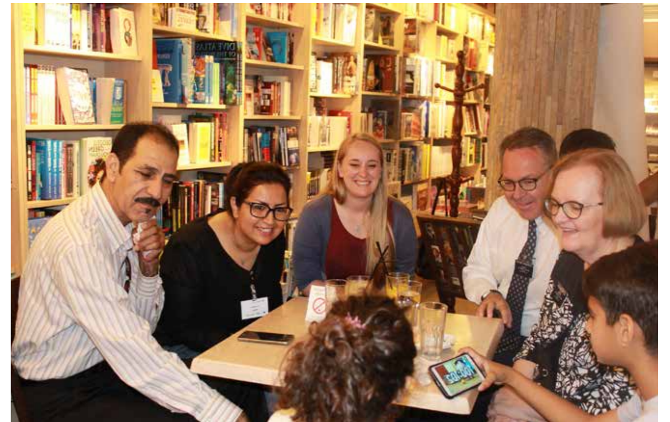
Pomoć na putu