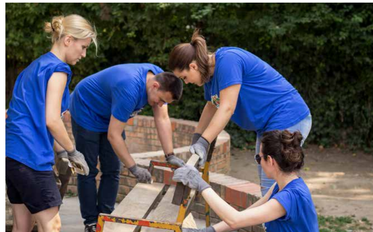
Festival filantropije - volonteri