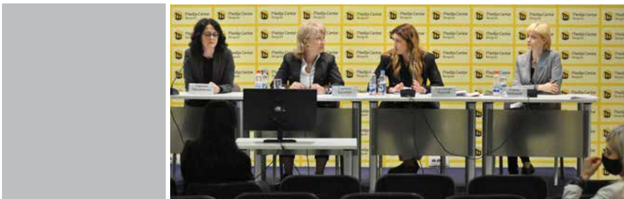
Projekat "Jednaki" - Konferencija za medije

Više o projektu možete pročitati na sajtu www.jednaki.com