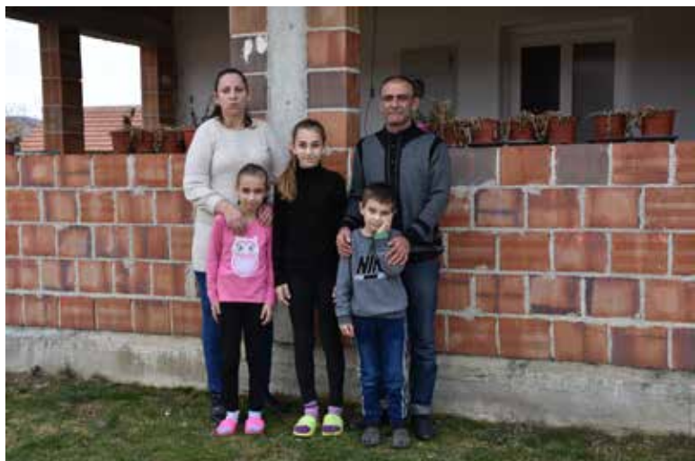
Porodica Komatović, Žač