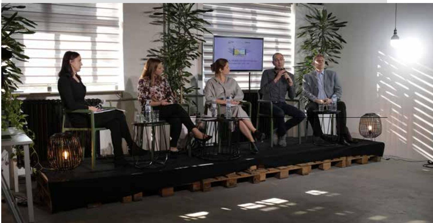
Panel "Mentalno zdravlje na radnom mestu"