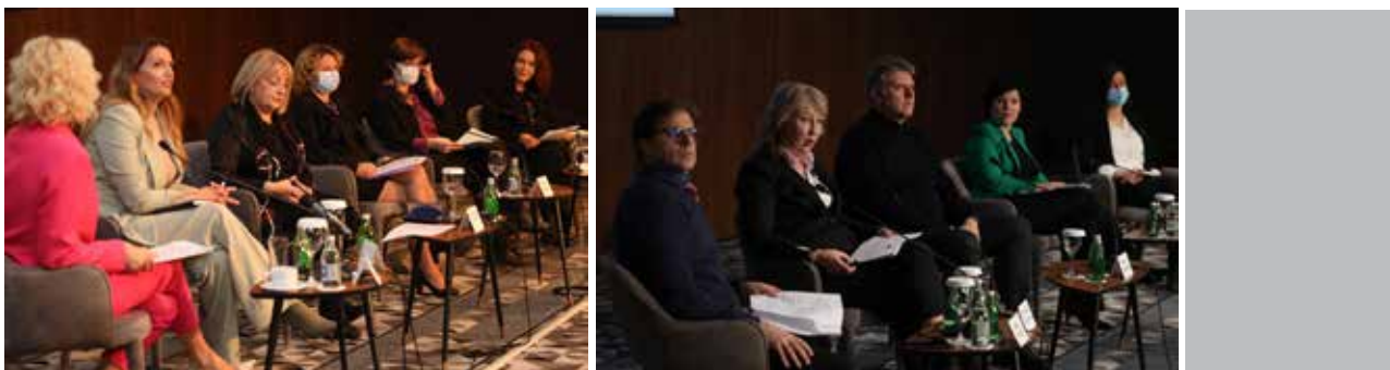
Projekat "Jednaki" - Nacionalna konferencija