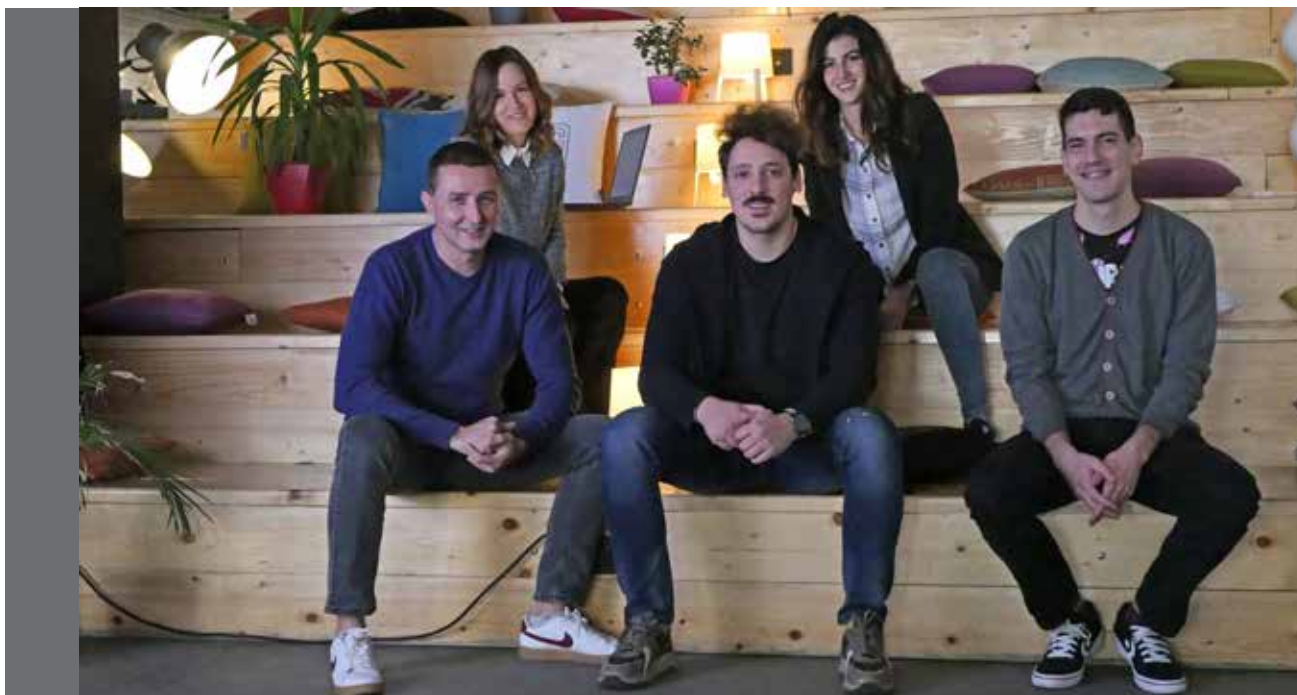
IT Bootcamp 2021