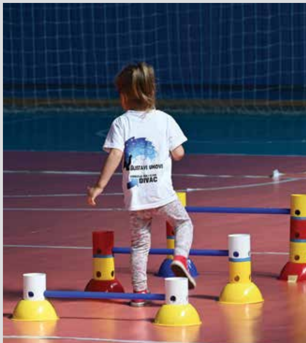
Inkluzivna radionica Defektološkog kabineta „BLISTAVI UMOVI“

Takođe, kroz konkurs smo podržavali i medije da prebrode situaciju nastalu zbog krize izazvane pandemijom tako da je dnevni list Danas dobio sredstva za projekat "Budi Danas solidaran" zahvaljujući kome smo mogli da čujemo 10 priča o lekarima u crvenoj zoni. Podržali smo lokalni medij Radio Požega u osnivanju njihove omladinske sekcije kako bi se glas mladih iz njihovog kraja čuo u doba pandemije.