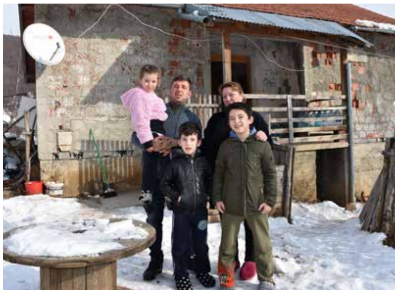
Porodica Krstić, Ljevoša