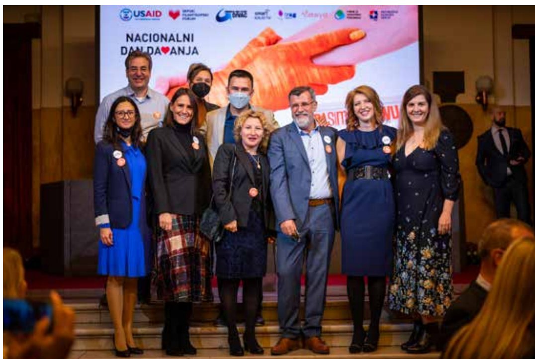
Obeležavanje Nacionalnog dana davanja

Iako je i tokom 2021. godine situacija sa pandemijom nastavila da utiče na mnoge aktivnosti i aspekte rada, Fondacija Ana i Vlade Divac, zajedno sa partnerima iz Koalicije za dobročinstvo, nastavila je rad na predlozima za unapređenje zakonskog okvira i promociji dobročinstva, fokusirajući svoje aktivnosti na doniranje hrane.