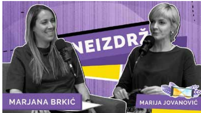
Podcast “Neizdrž” – Zašto ravnopravnost ne može da čeka