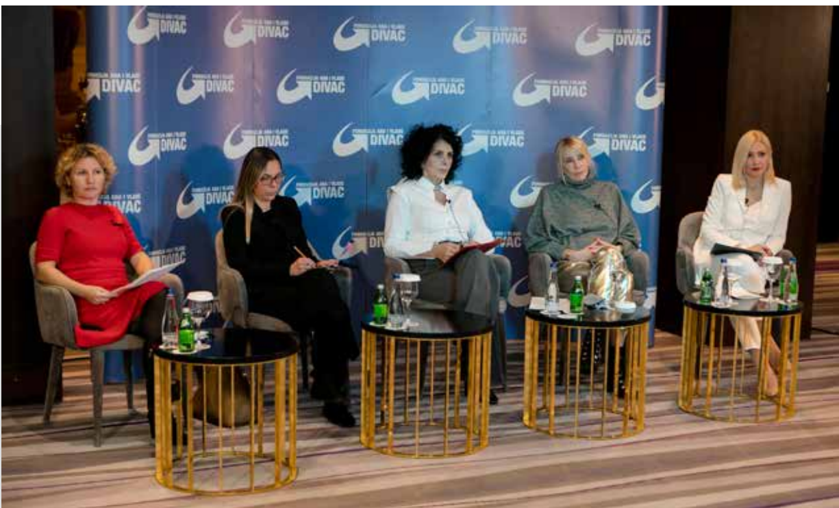
Završna konferencija projekta "Solidarnost pre svega"

Imajući u vidu nastavak krize izazvane pandemijom KOVID-19 i neizvesnu situaciju u kojoj se veliki deo preduzetnika i preduzetnica u Srbiji našao, Fondacija Ana I Vlada Divac je za 10 izabranih biznisa obezbedila besplatni trening i podršku u znanju za digitilizaciju njihovih biznisa.