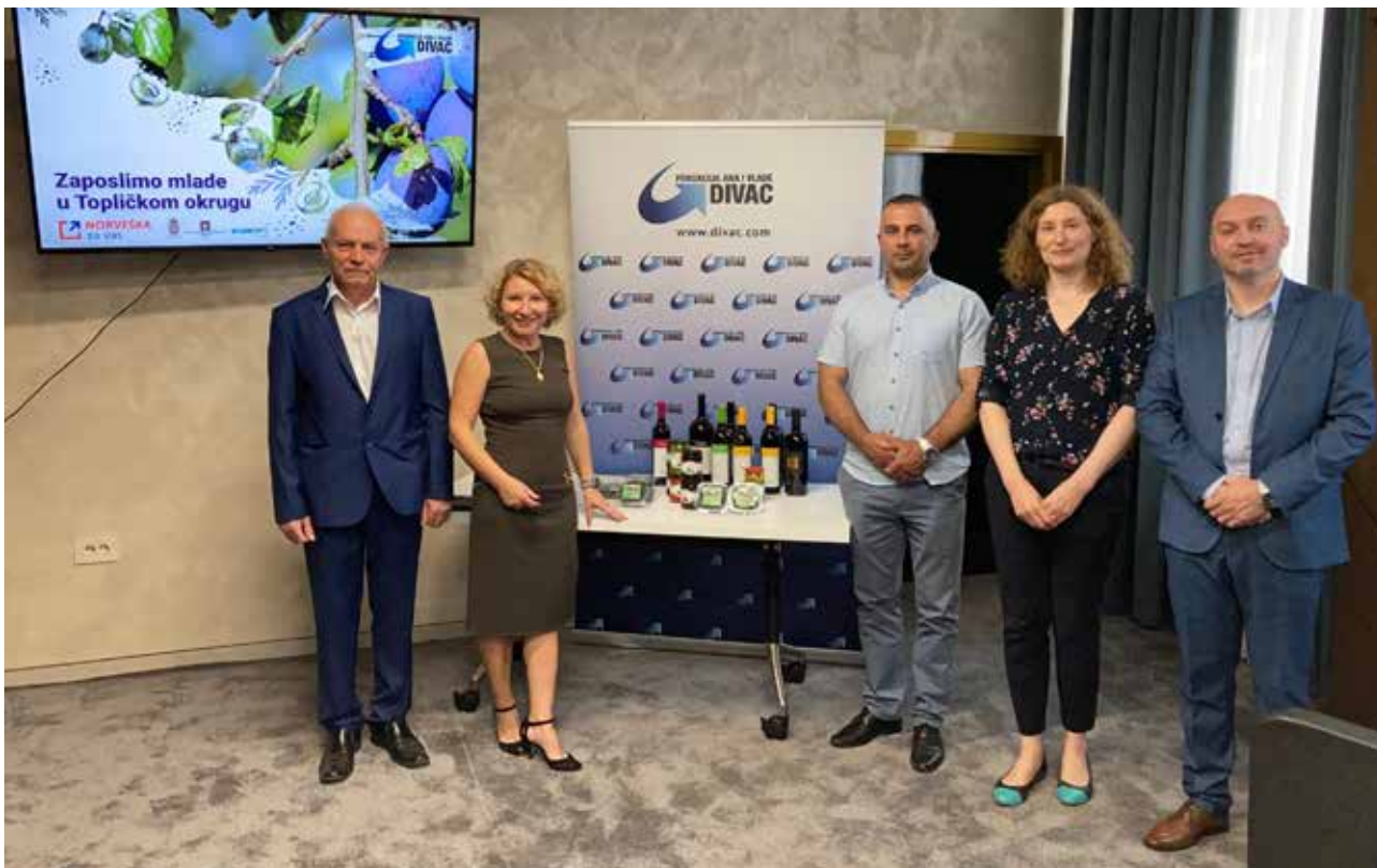
Poseta Topličkom okrugu