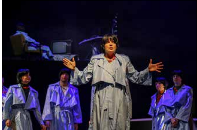
Predstava "Trenutak pre zasićenja"

Kao posledica zatvaranja zbog KOVID-19 pandemije sektor kulture kao i kulturni radnici takođe su bili dosta pogođeni prethodnih meseci tako da smo podržali kreiranje predstave Pozorišna predstava „TRENUTAK PRE ZASIĆENJA“ PULS teatra iz Lazarevca, Udruženje Art Aparat i njihov projekat "Svi UGLAS! - Mladi pevaju na romskom", kao i Seoski kulturni centar Markovac.