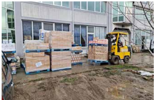
Dostavljanje donacije Crkvenoj narodnoj kuhinji u Beogradu

Zahvaljujući našoj dugoročnoj saradnji sa kompanijom P&G, više od 6.000 zdravstvenih i higijenskih proizvoda pristiglo je u Crkvenu narodnu kuhinju i u nacionalno udruženje roditelja dece obolele od raka Nurdor Srbija. Ovo je početak akcije u okviru koje ćemo u 2022. godini deliti proizvode udruženjima širom Srbije sa ciljem da podržimo najugroženije kategorije stanovništva i obezbedimo im sredstva za ličnu higijenu i sredstva za održavanje prostorija.