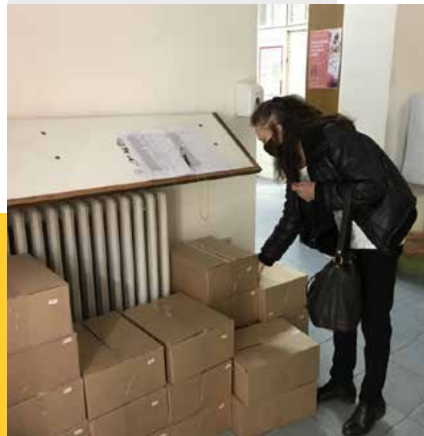
Dodela paketa u Centru za socijalni rad Zvezdara