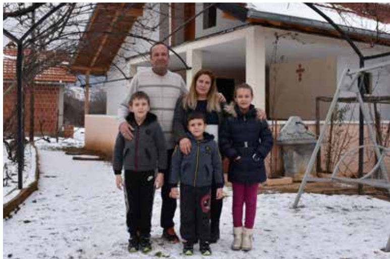
Porodica Pavlović, Belo Polje

Siromaštvo nije jedini problem sa kojim se suočavaju porodice koje žive na Kosovu i Metohiji. Ugrožena bezbednost, socijalna isključenost, nemogućnost pristupa obrazovnom sistemu i tržištu rada dodatni su problemi sa kojima se stanovništvo na Kosovu i Metohiji bori. Ovim porodicama najteže je zimi – bez ogrjeva, dovoljno hrane, sredstava za ličnu higijenu. Zahvaljujući našoj dugogodišnjoj donatorki Anki Erne i bratstvu manastira Visoki Dečani, pomoć je stigla do onih kojima je najpotrebnija. Najsiromašnijih 40 porodica sa preko 135 članova dobilo je ogrev, nameštaj, kućne aparate, ugradne kuhinjske elemente, stočnu hranu, nove štale, poljoprivredne mašine i drugo. Takođe, porodicama su uručeni i paketi hrane, odeće i obuće i sredstava za ličnu higijenu. Farma Eparhije raško-prizrenske dobila je podršku za proširenje proizvodnje i razvoj, a O.Š. u Osojanu, opremu za internet i drva. Pored ovih vidova pomoći, za bolnicu u Kosovskoj Mitrovici obezbeđen je biohemijski analizator najnovije generacije, u vrednosti od 35.000 dolara.