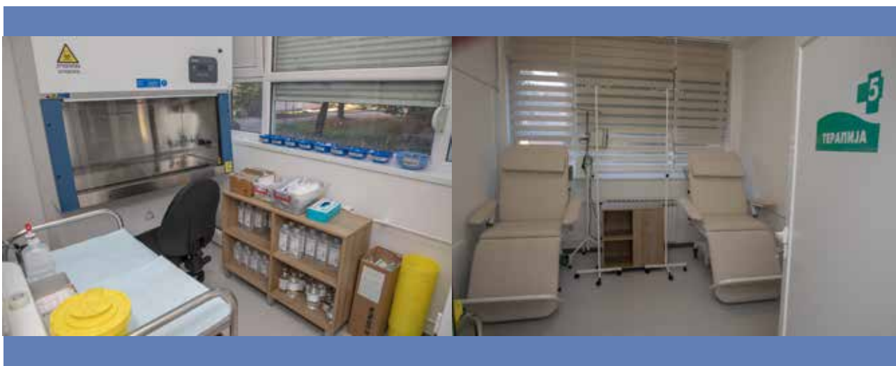
Opšta bolnica Kruševac

Ukupna donacija za Opštu bolnicu Kruševac iznosi više od 20 miliona dinara zahvaljujući podršci višegodišnjih donatora Fondacije Ana i Vlade Divac.