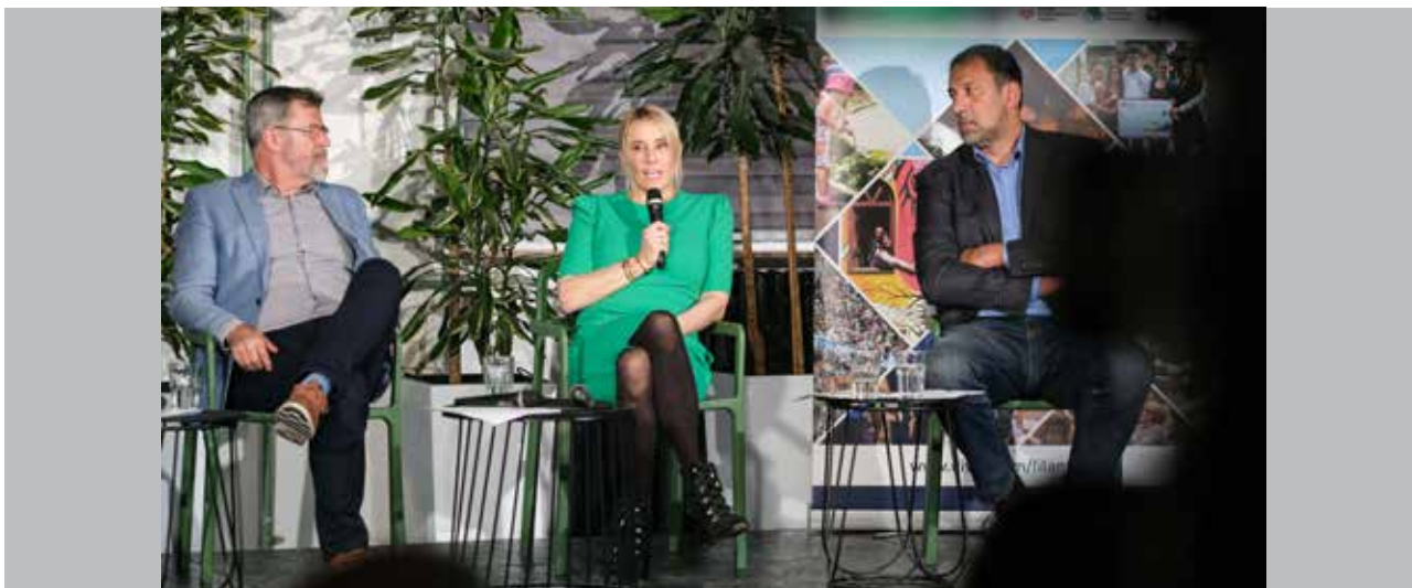
Panel o saradnji sa dijasporom