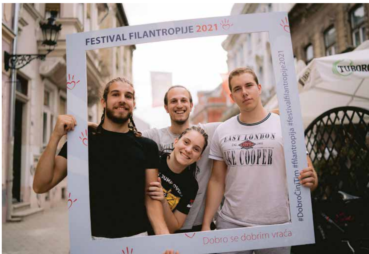
Ulične priče, Novi Sad