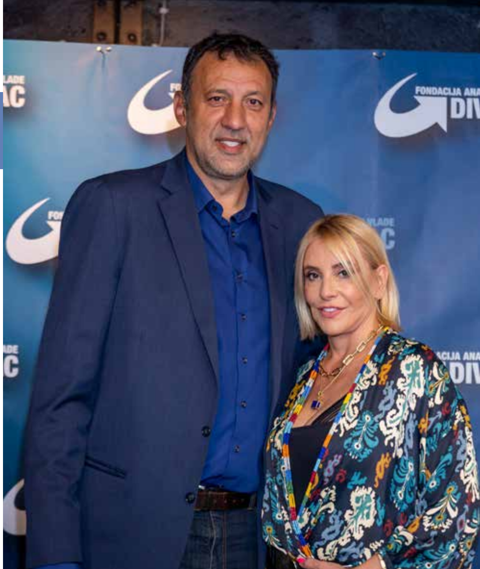
Ana i Vlade Divac

Tokom protekle godine nastavili smo da se suočavamo sa izazovima pandemije, povremeno prinuđeni na virtualna okupljanja, uprkos velikoj želji i potrebi za susretima uživo i razmeni iskustava, energije, pohvala, i nekad neophodnih kritika. Uprkos tome, uspeli smo da sprovedemo veliki broj akcija i projekata, pa je izazov da rezultate iz 2021. godine ukratko predstavimo. Svakako bismo želeli da naglasimo trud koji su naši brojni volonteri, saradnici, partneri i donatori, uložili da bismo zajednički pomogli što većem broju ljudi, ali i pokrenuli diskusije o važnim društvenim pitanjima.